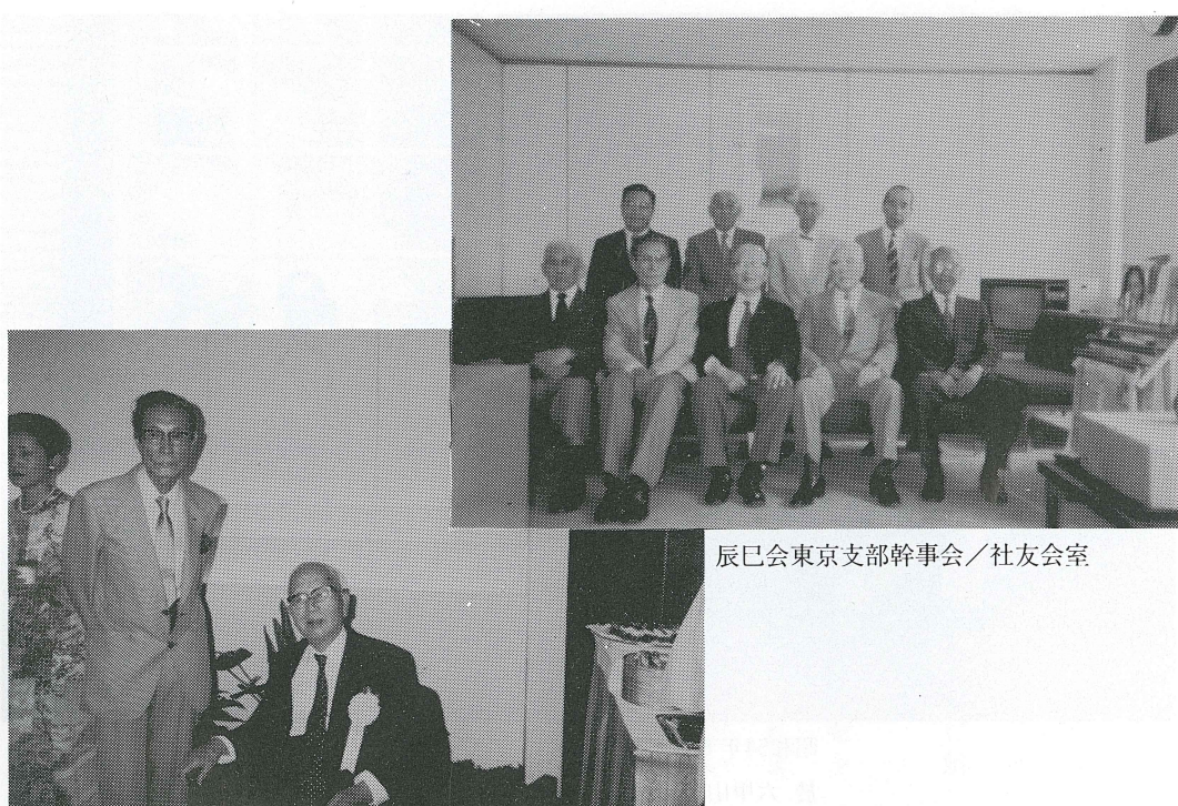
辰巳会東京支部幹事会/社友会室